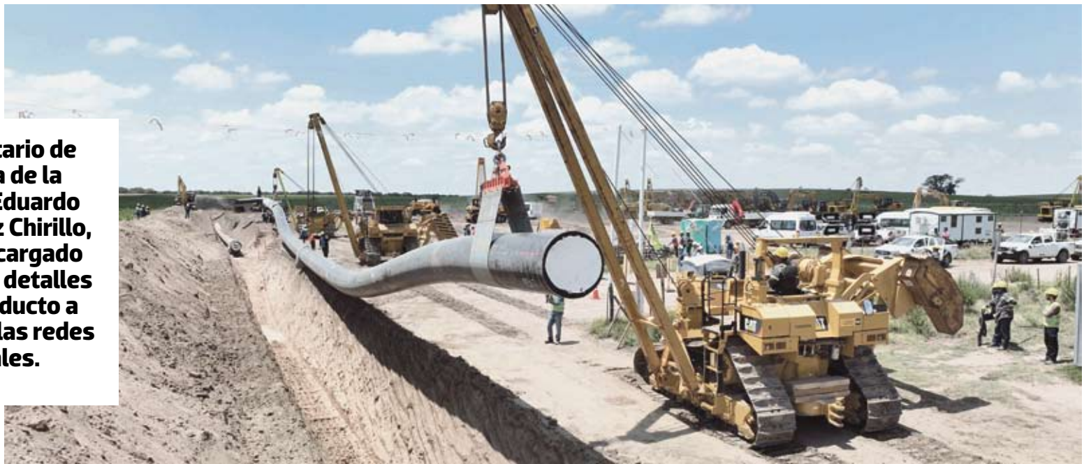
Gasoducto Presidente Néstor Kirchner.