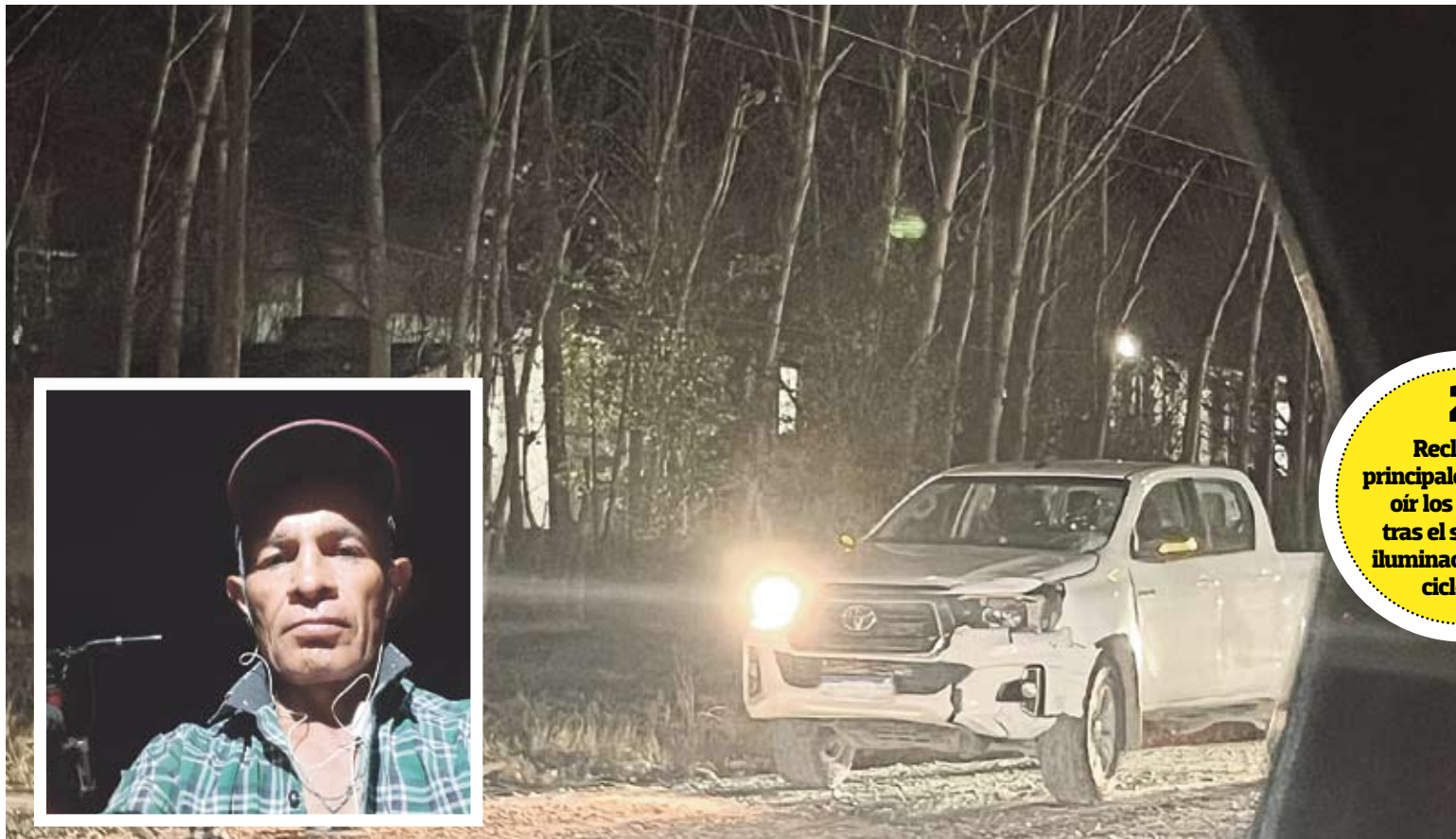
El siniestro fatal se registró a unos dos kilómetros de la localidad de Añelo, sobre la Ruta Provincial 17, en un sector que no cuenta con iluminación.

Ocurrió en la Ruta 17, cerca de Añelo. Los vecinos piden luminarias.