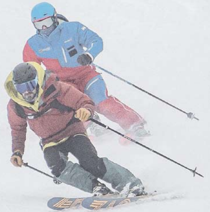
Las nevadas tempranas adelantaron la apertura de los centros de esquí.

Chapelco activó los siguientes medios de elevación: Telecabina, Magic Carpet 1600, Silla 63, Silla Graef y Palito. Las pistas habilitadas fueron Pista 63, Del Bosque, Camino hasta 1600, Pioneros hasta 1600 y Palito. En el Bayo se habilitó la telesilla principal, que parte desde la base hasta la cota 1500. Los principiantes pudieron disfrutar de la zona carpet 1 y 2. También estuvieron habilitadas la Conexión 1500, la pista 18 y la conexión 18. En materia gastronómica, abrieron Oso Point y el parador Amex en la base y Tronador y parador Milquinientes en cota 1500 ●