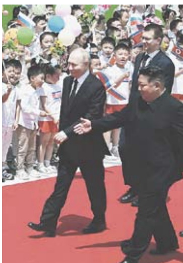
Putin fue recibido a toda pompa en Pyongyang por Kim Jong-un.

Así lo afirmó el líder norcoreano Kim Jong Un durante la visita de Estado a Pyongyang de Vladimir Putin, la primera que realiza en 24 años, apremiado por la necesidad de municiones. Durante la visita del presidente ruso, los dos