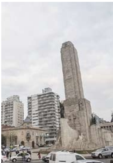
El acto en el Monumento a la Bandera comenzará hoy a las 9.

El acto se realizará desde las 9 en el Mástil Mayor del Monumento a la Bandera. La ceremonia contará con transmisión por los canales oficiales de Presidencia. “El Presidente de la Nación Javier Milei viajará a Rosario para conmemorar el día de la Bandera”, indicó el vocero