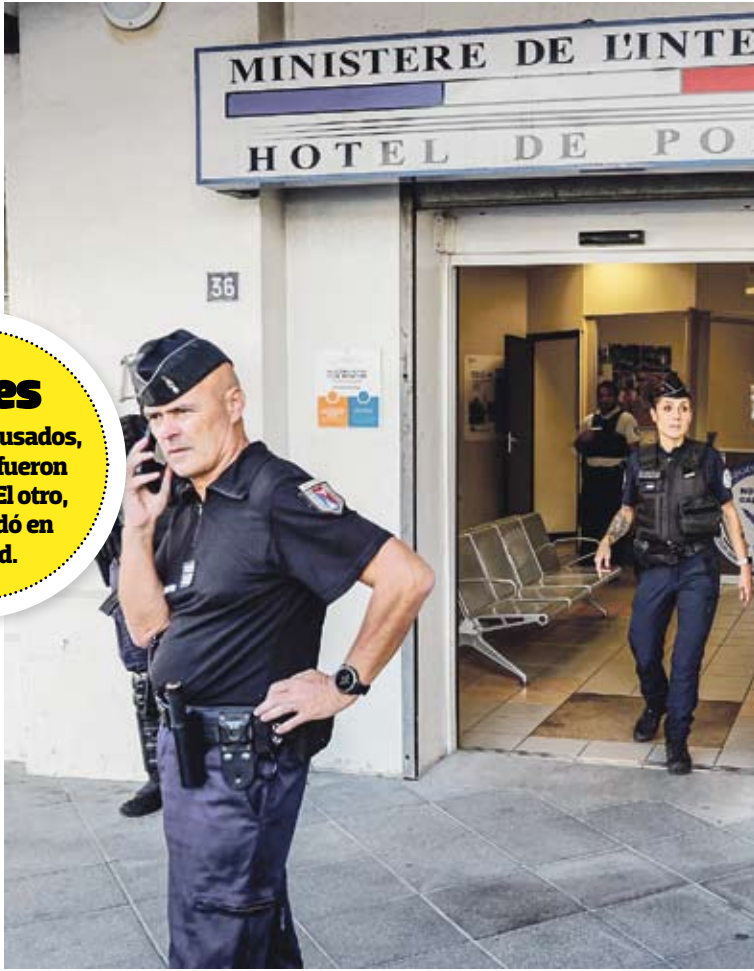
Francia en shock tras esta violación en un ataque de carácter antisemita.

Tras el insulto, llegó una violencia sin precedentes. La arrojaron al suelo, la golpearon, la fotografía-