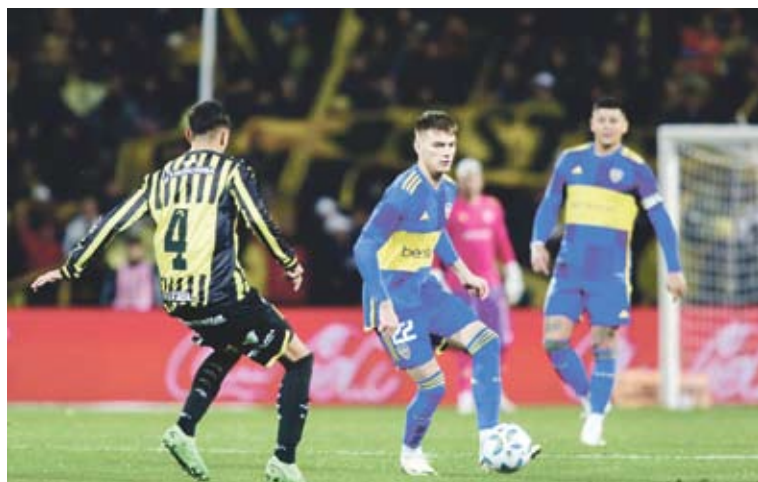
El Xeneize se dejó estar y Almirante Brown lo asustó un poco en el final.

Por Copa Argentina derrotó con lo justo a un equipo del ascenso.