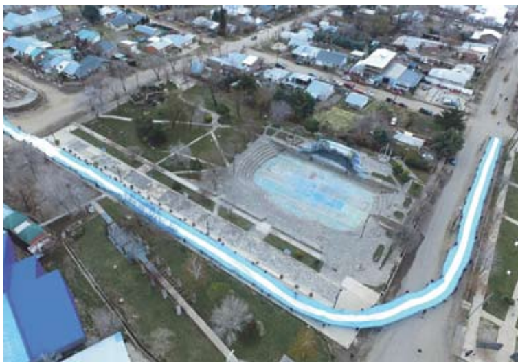
El Día de la Bandera tendrá un condimento especial en Andacollo.

Fue así como en seis años, lograron coser 400 metros de largo de