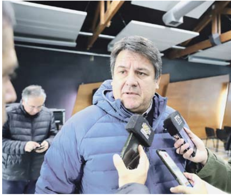
Gaido destacó que la tasa es para no aumentar más el boleto de colectivo.

Gaido aseguró que hoy, parte del dinero que pagan los automovilistas neuquinos en las estaciones de servicio no representa el valor del combustible ni la rentabilidad de los estacioneros. “Lo recaudan los estacioneros para dárselo a Buenos Aires”, dijo y aclaró que es dinero que le corresponde a la ciudad de