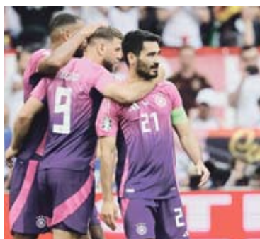
Otra convincente actuación de los locales, esta vez ante Hungría.

ALEMANIA Alemania volvió a hacerse fuerte luego de la goleada en el debut y en el arranque de la segunda fecha de la Eurocopa venció a Hungría, en Stuttgart. Fue 2-0 con los goles de Jamal Musiala y Ilkay Gündogan, que metieron a los de Nagelsmann en los octavos de final del torneo.