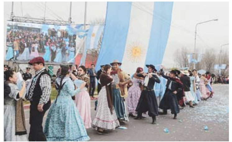
La ciudad conmemora el Día de la Bandera.