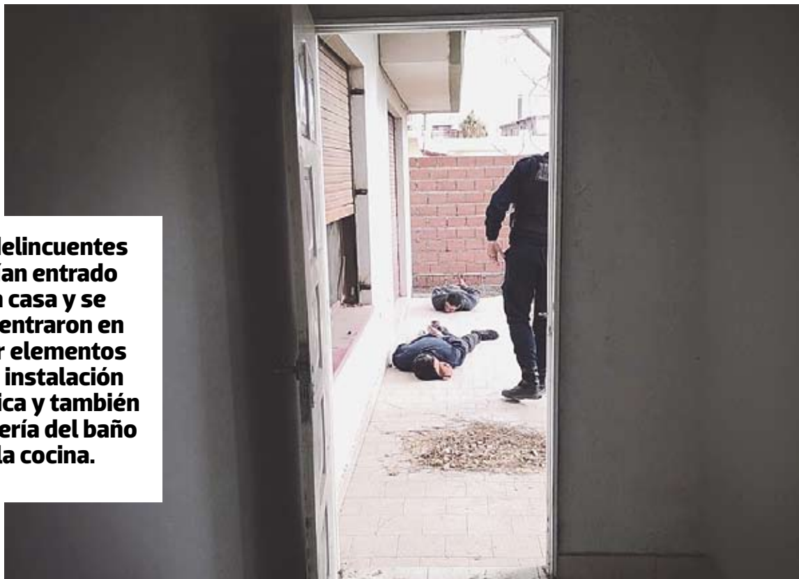
Los ladrones atrapados en el interior de la casa pretendían llevarse instalaciones eléctricas y grifería.

Los delincuentes habían entrado a la casa y se concentraron en robar elementos de la instalación eléctrica y también la grifería del baño y la cocina.