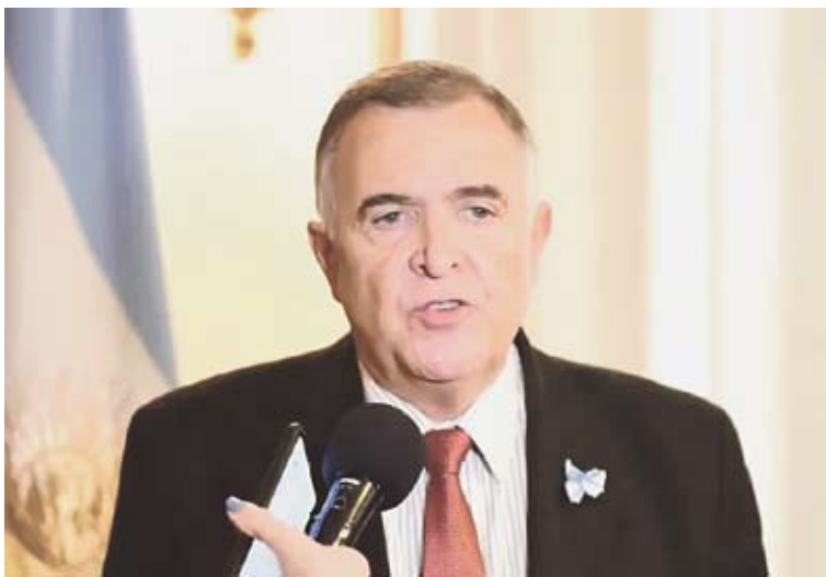
El actual gobernador de Tucumán dijo: “El es grande, sabe lo que hizo”.