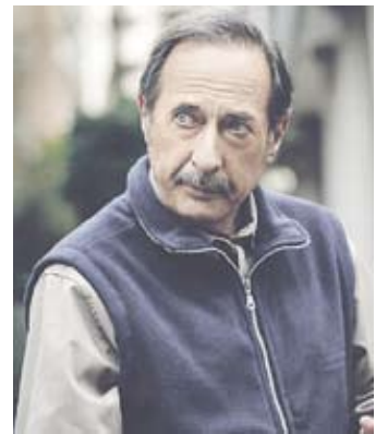
Guillermo Francella, como Eli-seo, llega el 19 de julio.

rie así podrían sucederle a su vida cotidiana, Olivia Cooke asegura: “Me preocupaba tener muchos ojos puestos sobre mí, pero en realidad todo va bien. De alguna manera, la exposición aumenta cuando sale el programa, pero luego vuelve a apagar”, dijo la estadounidense ●