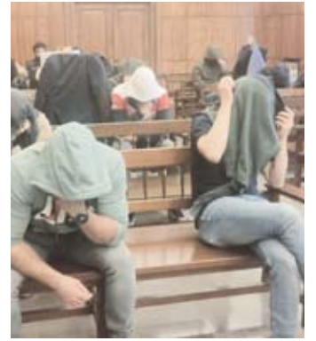
Difundieron el video de una pareja teniendo sexo en España.

Las investigaciones, primero confiadas a la comisaría de Courbevoie y luego a la brigada territorial de protección de la familia, permitieron detener a los tres sospechosos el lunes. Fueron acusados de "violación agravada, agresión sexual agravada, tentativa de extorsión, invasión de la intimidad, amenaza de muerte, violencia e insultos", siendo estos dos últimos delitos agravados por su comisión en razón de la afiliación religiosa de la víctima ●