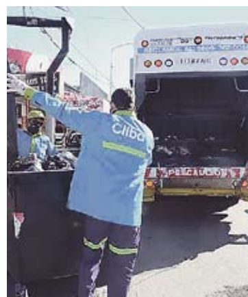
Los colectivos tendrán la frecuencia de un domingo hoy y mañana.

La Municipalidad comunicó que mantendrá guardias logísticas para emergencias y no atenderán las áreas de atención al público. En tanto, la recolección de residuos y barrido de calles funcionará con normalidad. En el caso de los Centros de Transferencia, el jueves y el viernes permanecerán cerrados, mientras que sábado y domingo operarán con normalidad.