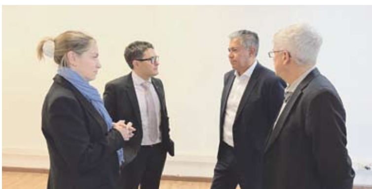
El plan otorga aportes en dinero y capacitación.

El Plan otorga aportes dinerarios y no dinerarios a neuquinos y neuquinas de entre 4 y 35 años, para acompañar su desarrollo educativo, personal y su formación integral. Además, contempla el