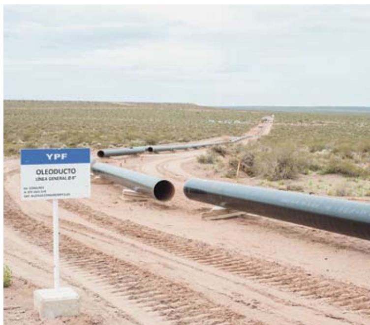
La obra permitirá terminar con uno de los cuellos de botella del shale oil en la cuenca.

Este primer tramo es estratégico porque permitirá ampliar la producción de petróleo mientras se aguarda la obra definitiva. Unirá las localidades de Añelo, en Neuquén, con Allen, en nuestra provincia, para conectar con el sistema de Oldelval. Esto permitirá aumentar