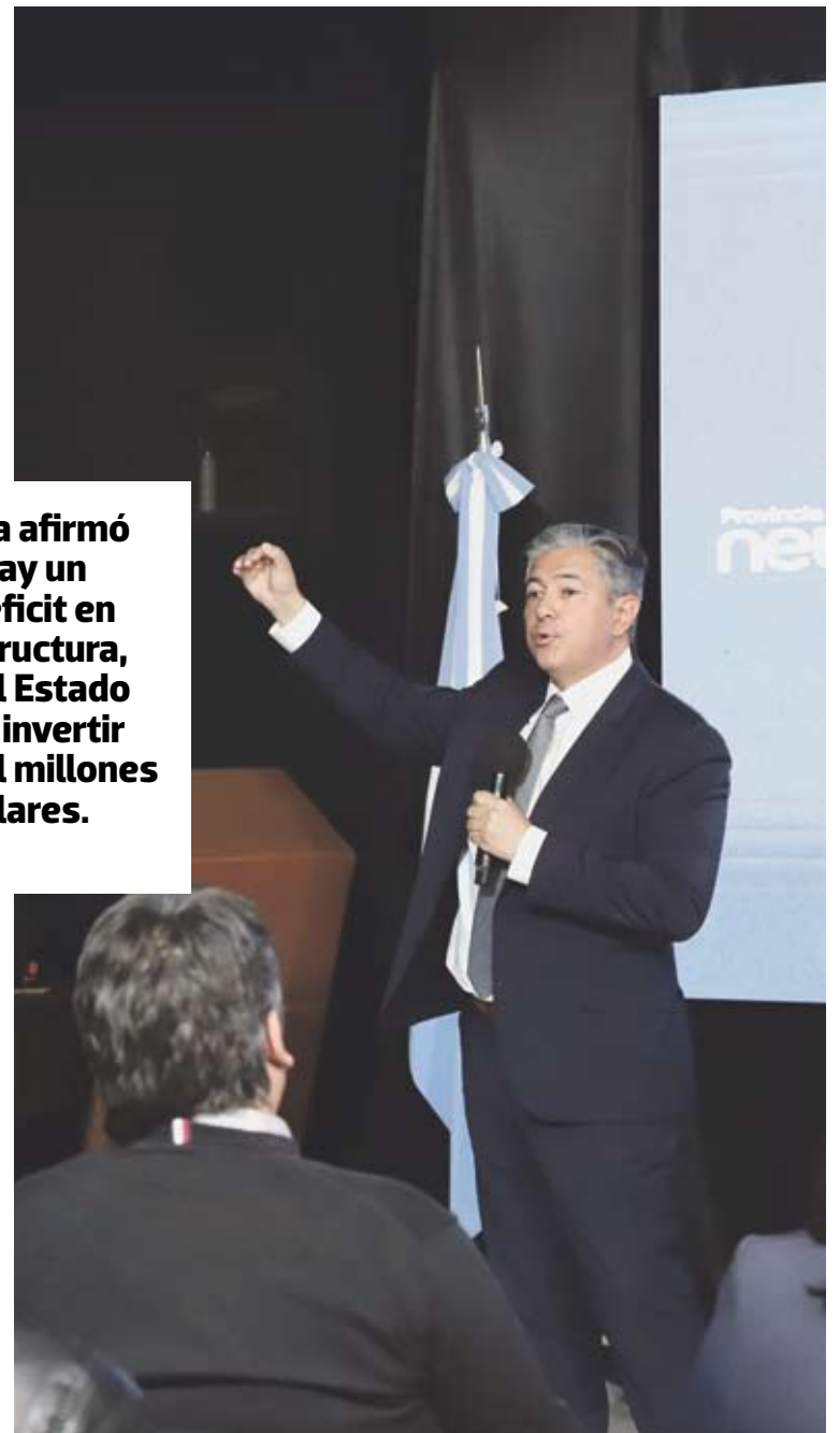
El gobernador Figueroa hizo estos anuncios durante la presentación del Plan de Infraestructura No Convencional para la provincia de Neuquén.

Figueroa afirmó que hay un gran déficit en infraestructura, donde el Estado debería invertir unos 4 mil millones de dólares.