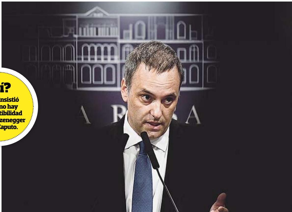
“Ya lo decía Néstor Carlos Kirchner, ‘el equilibrio fiscal debe cuidarse, eso implica más y mejor recaudación’”, dijo.

¿Sí? Adorni insistió en que no hay incompatibilidad entre Sturzenegger y Luis Caputo.