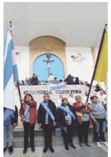
Monseñor Ojea, en una misa, cuestionó al Gobierno por los alimentos.

Ojea planteó su preocupación por la situación alimentaria y el crecimiento de la pobreza, sobre todo en los barrios populares del Conurbano ●