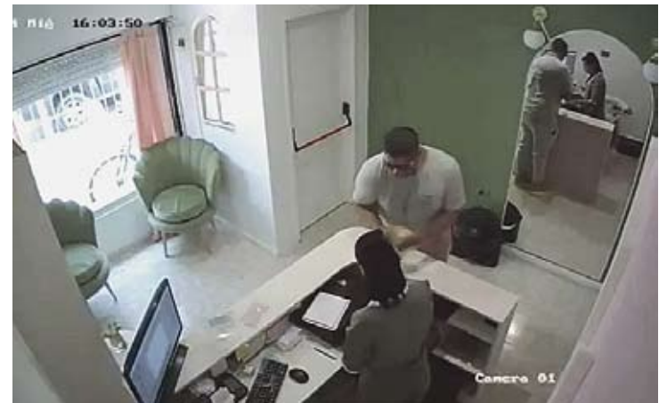
El ladrón de las estéticas enfrenta una acusación por cuatro hechos.

El plazo de extensión que solicitó de estas medidas fue desde el 23 de junio hasta el 9 de agosto, fecha en la que está prevista la finalización del juicio que se realizará en Junín de los Andes para debatir la responsabilidad penal de la acusada. Como argumento, planteó que existe riesgo de fuga ●