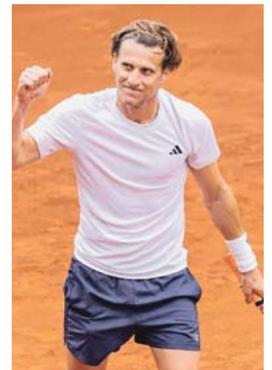
El ex delantero se destaca con la raqueta en torneos para +45.

Tras jugar en Uruguay, ahora, se animó a ir un poco más allá y ser parte del MT 1000 en Lima, en categoría más 45. ●