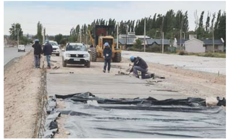
La obra fue muy solicitada por los vecinos del Oeste.

El barrio Los Polvorines nació como un asentamiento que ya tiene casi 40 años de historia. Antiguamente, cuando la zona aún estaba rodeada de chacras, ocupaban parte de esas tierras un par de crianceros que las usaban para pastar sus vacas y desarrollar su actividad agropecuaria.