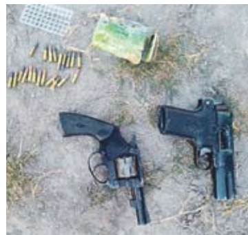
La barra de Almirante llevaba pistolas, proyectiles y marihuana.