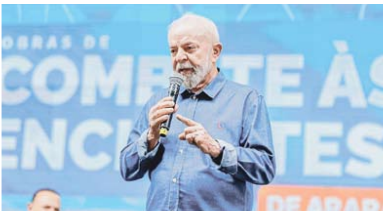
El líder del PT, de 78 años, asumió en enero de 2023 su tercer mandato.

En una clara referencia al Gobierno de Jair Bolsonaro (2019-2022), Lula señaló que no permitirá que el país vuelva a ser "gobernado por un negacionista". En una entrevista, el mandatario expresó: "Si fuera necesario ser candidato para evitar que los trogloditas que gobernaron este país vuelvan a go-