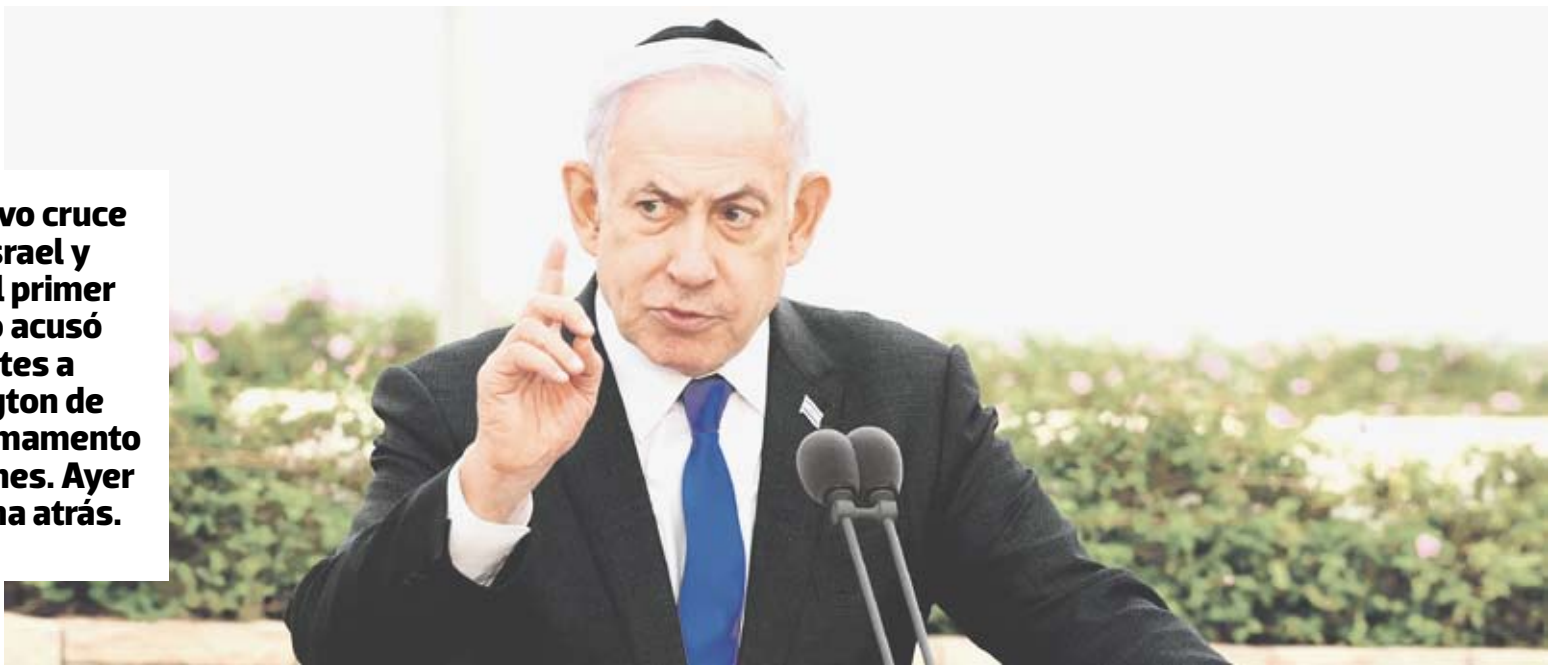
Benjamin Netanyahu, en la jornada de ayer, modificó su declaración luego de que la Casa Blanca dijera que no "sabía a qué se refería el premier".

En un nuevo cruce entre Israel y EE.UU., el primer ministro acusó el martes a Washington de retener armamento y municiones. Ayer dio marcha atrás.