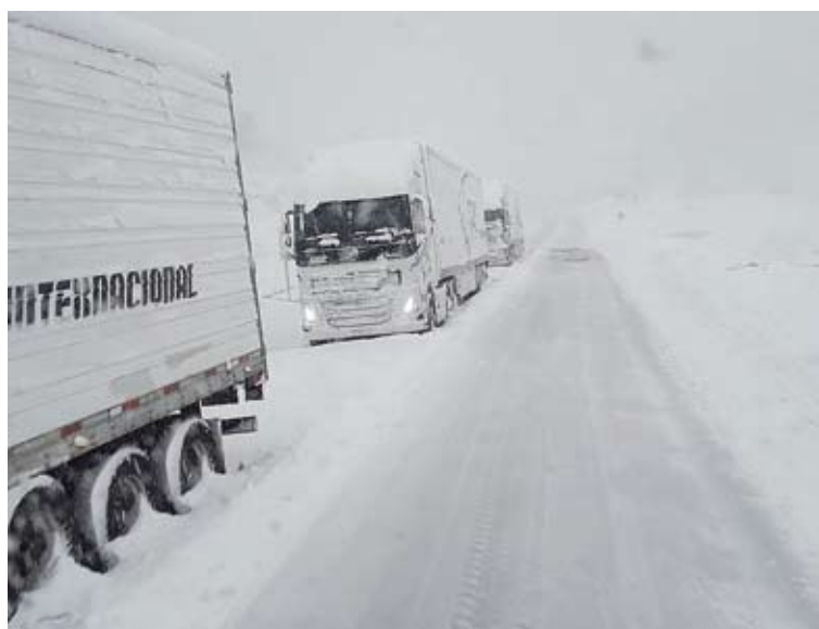
Las condiciones del clima no ayuda a los vehículos varados.

“El tiempo condiciona. La intención es abrir el paso durante la jornada (de este miércoles). De todas maneras, por lo que nos dicen, por