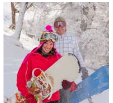
La desaparición del Previaje causó una desaceleración en la actividad.

Un hotelero experimentado de San Martín de los Andes analizó que la actividad turística volvió este año a los niveles que presentaba antes de la cuarentena por el