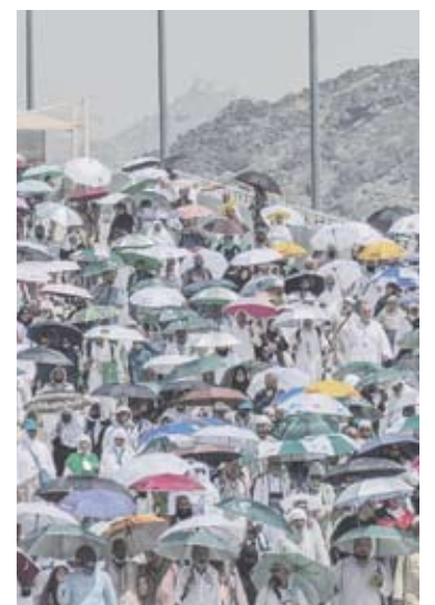
La mayoría murió por las altas temperaturas, superiores a los 50°.

Al menos 323 de los fallecidos son egipcios, que murieron por dolencias provocadas por el calor, exceptuando uno de ellos que falleció a causa de heridas sufridas en una dispersión desordenada de gente. Ese balance procede de la morgue de un hospital del barrio Al Muaisem de la ciudad saudita. Los reportes no precisan si las muertes se produjeron después de la inauguración oficial del hach, el viernes, o si se registraron fallecimientos previos entre los peregrinos que llegaron ●