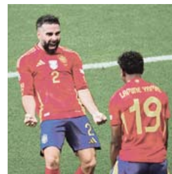
España se impuso en el debut ante Croacia con autoridad.

Por otro lado, además del triunfo alemán, ayer hubo empate entre Albania y Croacia (2-2) ●