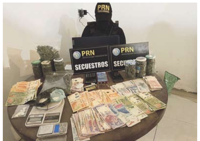
Los narcos de Roca tenían su kiosco de drogas en el barrio Fiske Menuco.

fuerzas de seguridad rionegrinas lograron desbaratar varios puntos de venta de drogas en el Alto Valle gracias a las denuncias anónimas que receptiona el 0800-DROGAS. Casi en forma simultánea, se hicieron operativos en las localidades de Chichinales y Allen y fueron imputadas cuatro personas por